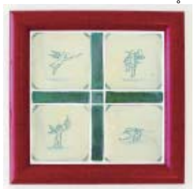
天使の陶板 山本教行作

す。建物は理念の変換体 です。言い換えれば理念 空間であり、人と地域の お役に立たせていただく 中で、皆様と私たちス タッフの出会いがアイナ リーホールに生命を与え ていくわけです。ぜひま たアイナリーでお会いし ましょう。